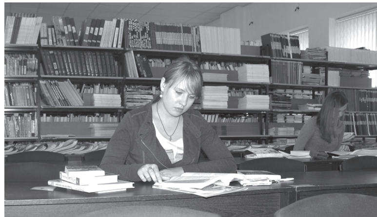
До сессии еще далеко, но учиться надо начинать с сентября. А возможности для этого собранная в зале литература предоставляет прекрасные

Для знакомства читателей с новой литературой в зале действуют постоянные выставки новых поступлений книг и журналов, электронных документов. Выставка «Электронные издания» постоянно пополняется статистическими данными и приложениями