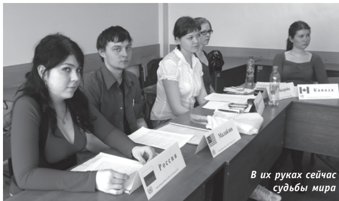
В их руках сейчас судьбы мира

В одном из предыдущих номеров «НА» уже рассказывала первокурсникам о такой увлекательной форме приобщения к будущей профессии, как игра «Модель ЕС». Сегодня мы расскажем еще об одной интересной и познавательной игре, в которую часто, притом не только в Новосибирске, но и в Москве, и даже в других странах, играют студенты НГУЭУ. Это игра «Модель ООН». Темой нынешней публикации является конкретная игра, состоявшаяся в нашем университете в конце минувшего учебного года.